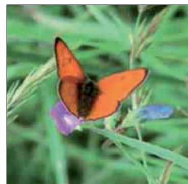
Fig. 176. Cuivré des marais ( Lycaena dispar )

Toute autre espèce d'intérêt patrimonial contactée a fait l'objet d'une recherche spécifique.