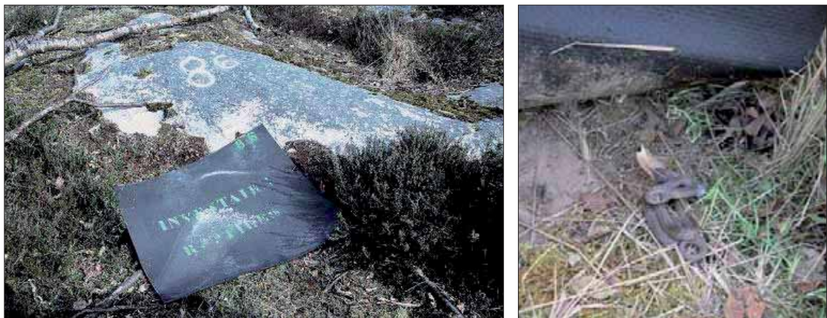
Fig. 175. Plaque noire installée sur le terrain / Coronelle lisse installée sous la plaque noire. Ce dispositif est particulièrement efficace les jours à ciel couvert

Animaux discrets, les reptiles doivent être recherchés en période chaude, idéalement assez tôt le matin pendant une journée ensoleillée : les animaux sont alors peu mobiles car engourdis et ils se placent à découvert pour profiter de l'ensoleillement.