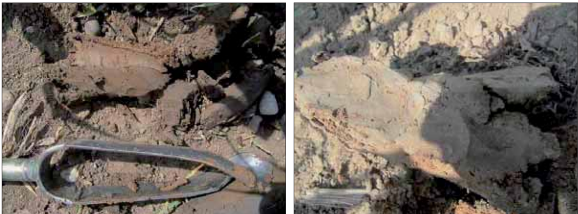
Fig. 171. Horizon redoxique (Pseudogley) à gauche - Horizon réductique (Gley) à droite

Les sondages sont faits à la tarière à main à une profondeur proche de 120 cm. Ils sont décrits, en insistant sur les indices liés à l'hydromorphie. Pour chaque sondage, les limites des horizons sont indiquées. Il s'agit ensuite de repérer les signes d'hydromorphie et d'indiquer leurs profondeurs d'apparition : taches d'oxydo-réduction et horizons réductiques.