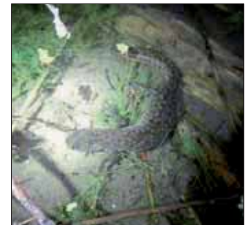
Fig. 173. Triton crêté (Triturus cristatus)

Une seule espèce patrimoniale est signalée sur le secteur (la Rainette verte) mais les milieux rhénans étant favorables aux amphibiens la présence d'autres espèces remarquables comme le Triton crêté est possible.